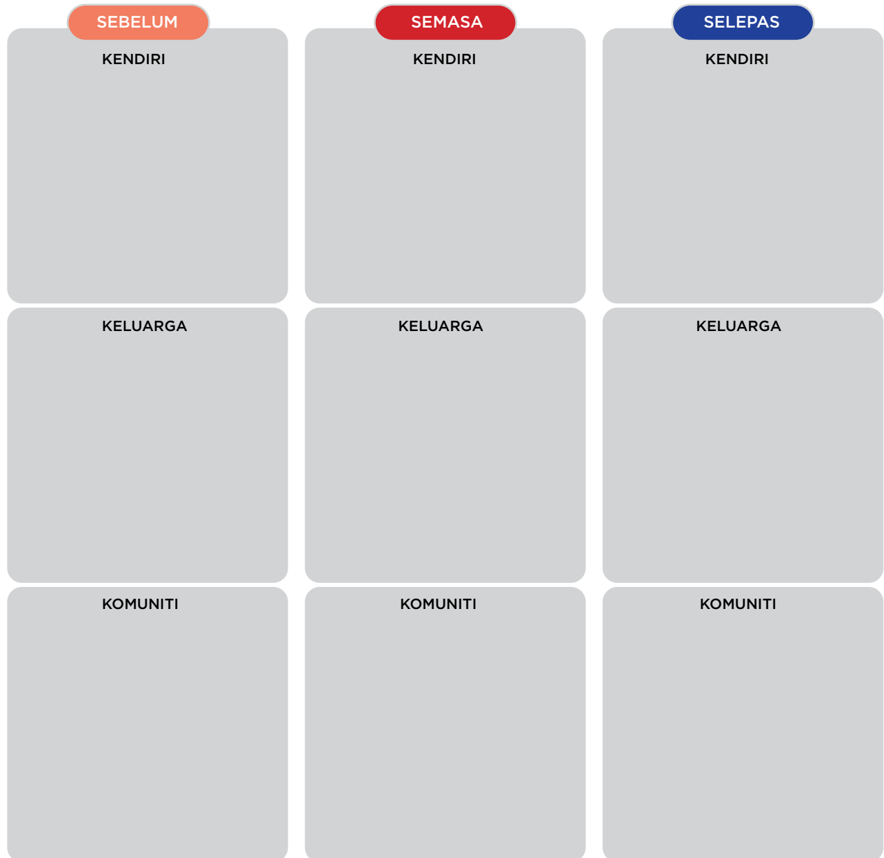
Gambar 1 : Jadual pengurusan sebelum, semasa dan selepas bencana di peringkat individu, keluarga dan komuniti.