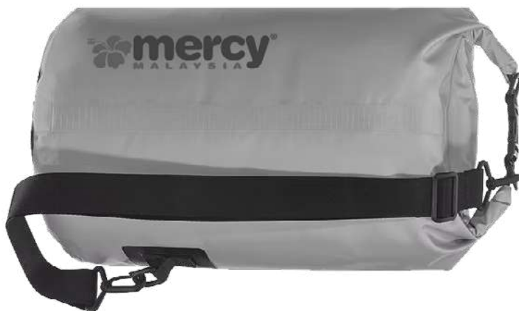
Gambar 5 : Aktiviti 4 - Keperluan Persediaan Menghadapi Bencana