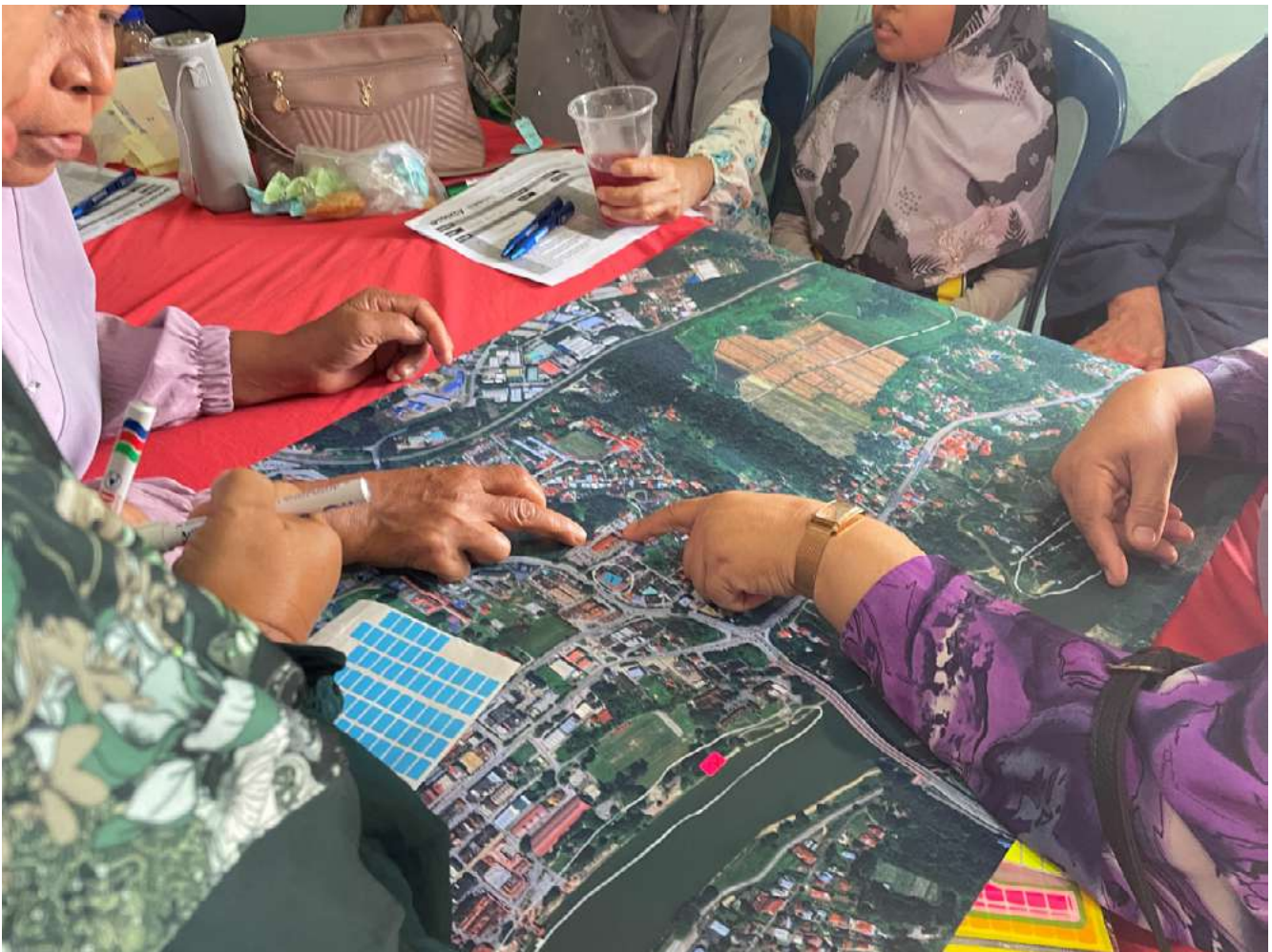
Gambar 6 : Pemetaan Kawasan