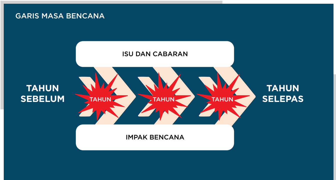
Gambar 2 : Aktiviti 1 - Garis Masa Bencana

Peningkatan kesediaan perancangan pengurangan impak risiko dalam komuniti